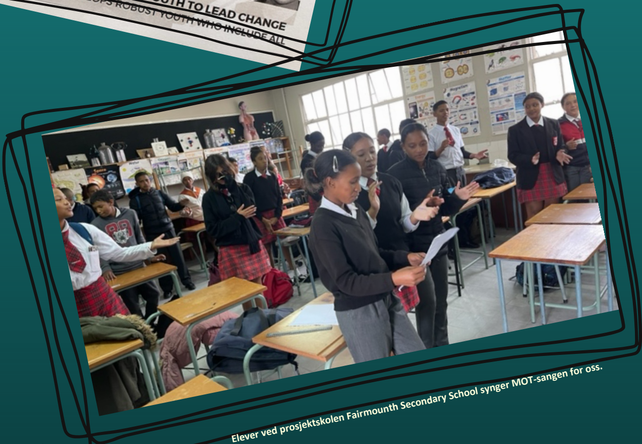
Elever ved projektskolen Fairmounth Secondary School synger MOT-sangen for oss.