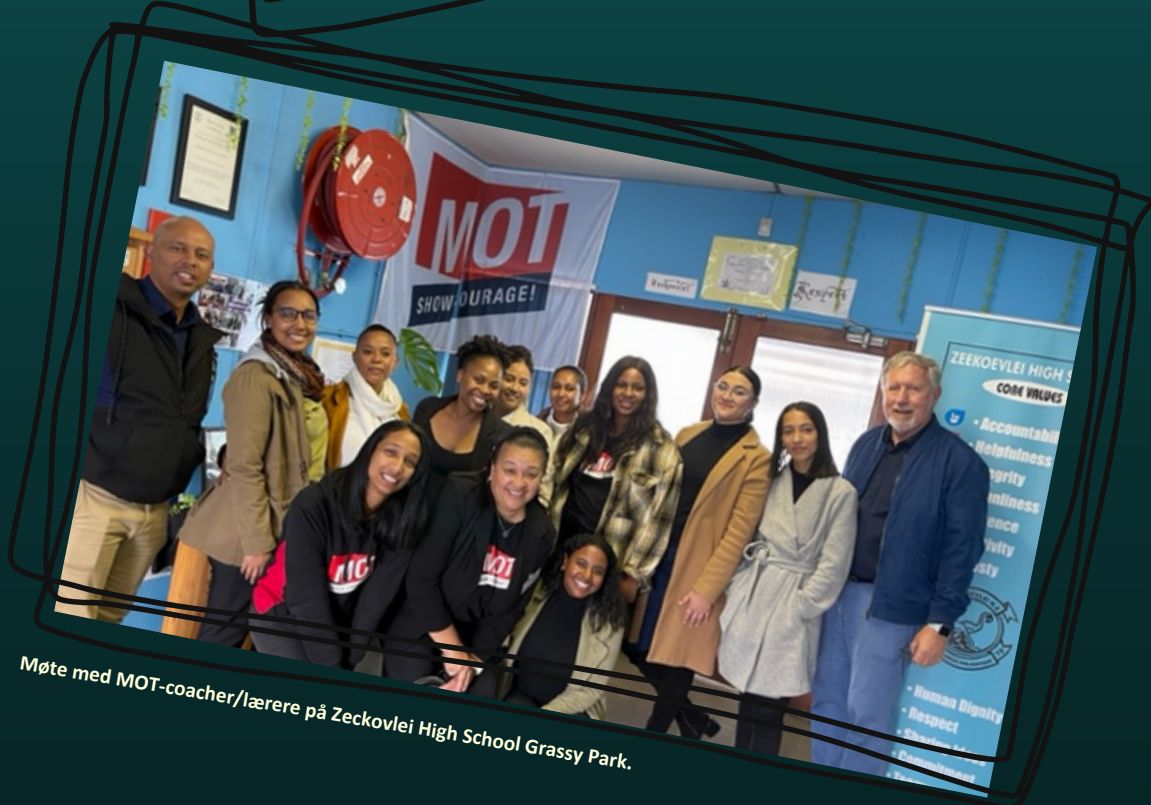
Møte med MOT-coacher/lærere på Zeckovlei High School Grassy Park.