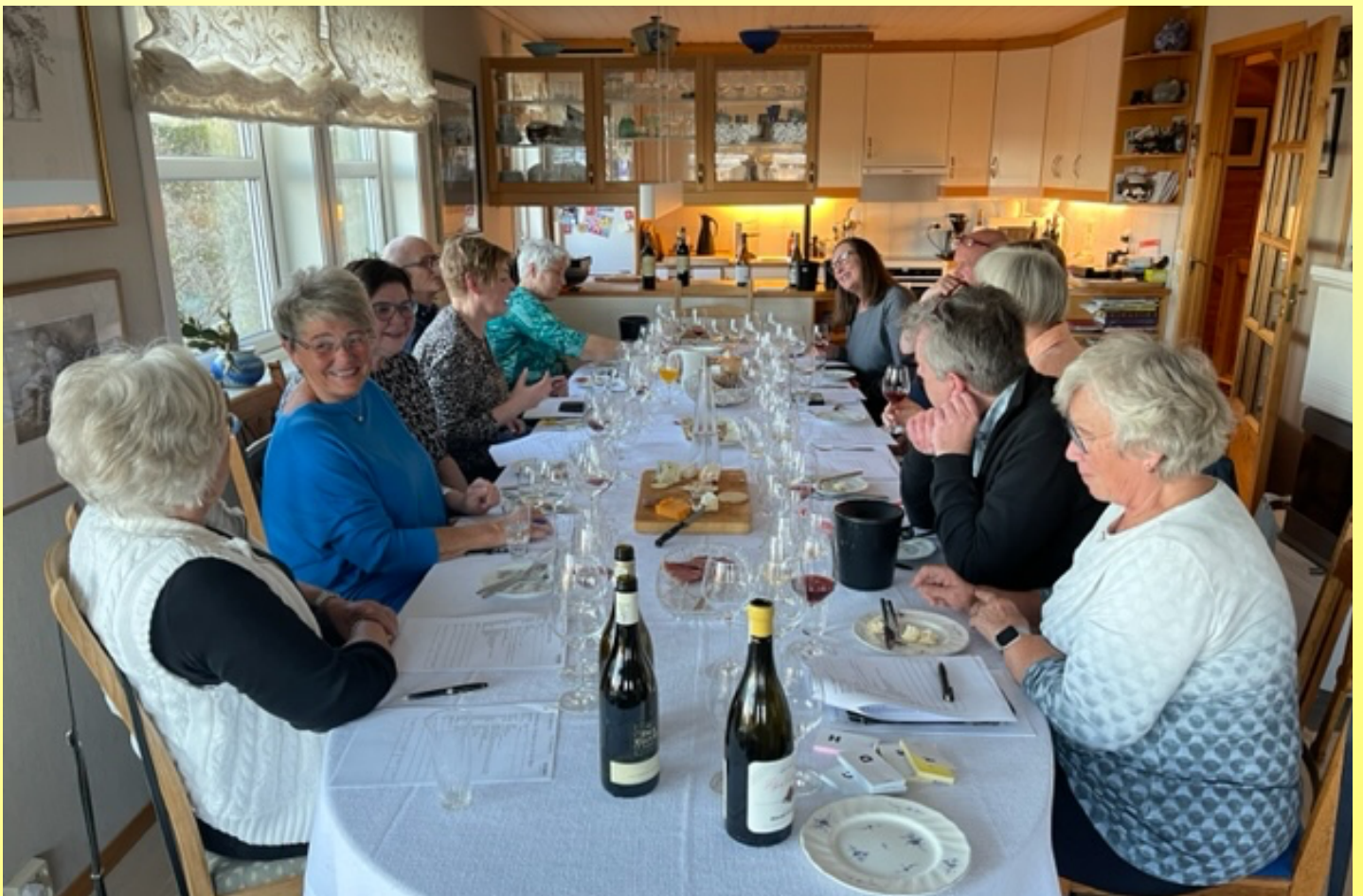
Fra vinsmakingen i Karmøy Rotary klubb.

Vi utfordrer andre klubber i D-2250 til å støtte opp om TRF, for våre bidrag avgjør hvor mye penger vi får til prosjekt i distriktet og klubbene og til Global Grant prosjekt om tre år.