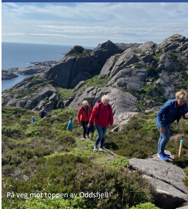
På veg mot toppen av Oddsfjell