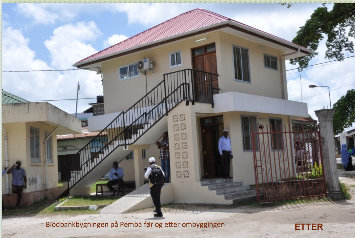
Blodbankbygningen på Pemba før og etter ombyggingen

Som et ledd i kampen mot overføring av HIV-infeksjon, har USA har lenge støttet blodbankoppbygging i Tanzania. Tanzania er et fattig land med høy forekomst av HIV – og en stor andel av pasientene som får blod er fødende kvinner og malaria-syke barn. Sikker transfusjons-tjeneste er derfor viktig for å hindre HIV-smitte. Da blodbanktjenesten i Tanzania ble utbygget, ble Pemba ikke tatt med i arbeidet.