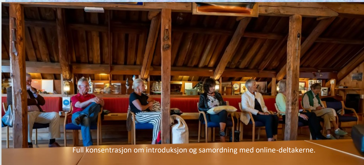
Full konsentrasjon om introduksjon og samordning med online-deltakerne.

Vi kan jo også få slik trening inn i bedrifter vi er knyttet til. Slik kan spredning- en bli enda mer effektiv.