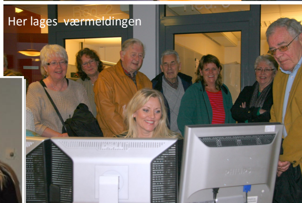
Her lages værmeldingen

te Bruarøy teknologien, og frem på det hvite lerretet dukket bilder og lyd og film opp etter hvert som foredraget skred frem. Det ble en spennende reise av en times varighet, der vi via mediens historie og spesielt Televisionens historie, fulgte en reise som starter med en tegning av det første "leseapparatet" og helt frem til presentasjon av dagens mest avanserte og web baserte løsninger med hundrevis av kanaler og mange typer TV systemer og nettbrett. Men det stoppet ikke der. Bruarøy er konsernets mann på fremtidsløsninger og for-