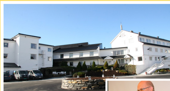
Flott ramme om PETS