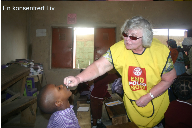
En konsentrert Liv

Og hva er så en NID - National Immunization Campaign - i en by som Kano?