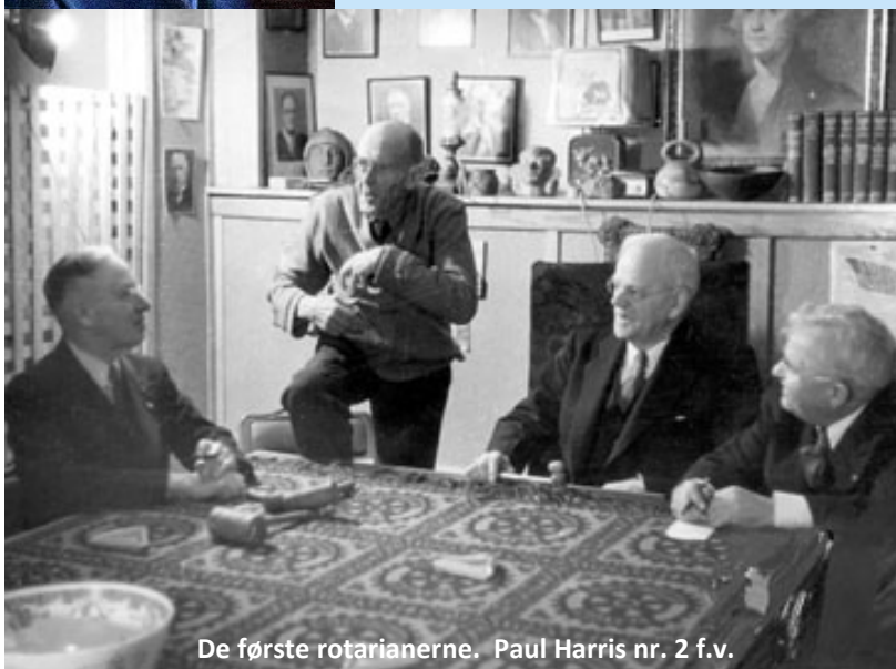
De første rotarianerne. Paul Harris nr. 2 f.v.

"Det er en bekreftelse på Rotarys idealer at en rotarianer nå presiderer over FN's Hovedforsamling. Til dette høye verv bringer jeg med meg Rotarys stolte tradisjoner. Her utøver jeg Rotarys misjon for menneskelig forståelse og Rotarys strålende holdning til godvilje, som er hovedhensikten med FN. Jeg sier åpent at Rotary har styrket mitt internasjonale perspektiv og min menneskefor-