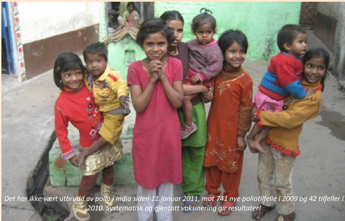
Det har ikke vært utbrudd av polio i India siden 11.januar 2011, mot 741 nye poliotilfelle i 2009 og 42 tilfeller i 2010. Systematisk og gjentatt vaksinerings gir resultater!

lokale helseteamene og landets egne myndigheter jobber jevnt og trutt året rundt. India er fortsatt et av de fire landene som betegnes som epidemiske. Men i 2011 brøt de den onde sirkelen. Det året hadde de bare 1 nytt tilfelle, mot 42 i 2010 og 741 nye tilfelle i 2009. Siste gang polio rammet et indisk barn var 13. januar i 2011. Det er en fantastisk gledelig nyhet og viser at innsatsen nytter!