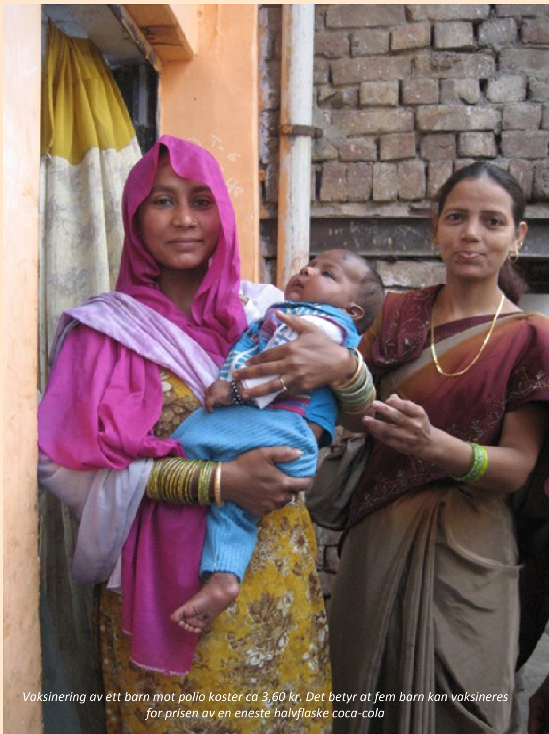
Vaksinering av ett barn mot polio koster ca 3,60 kr. Det betyr at fem barn kan vaksineres for prisen av en eneste halvflaske coca-cola

Rotary-klubbene i Norge arrangerer jazz- og kirkekonserter, auksjoner, turvandringar, løpemarkeder og andre former for innsamlinger året rundt til inntekt for kampen mot polio i tillegg til de andre humanitære prosjektene klubbene driver lokalt og internasjonalt.