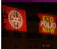
Lyste opp Grand hotell i Oslo

Flott markedsføring av Rotary i avisen "The economist"