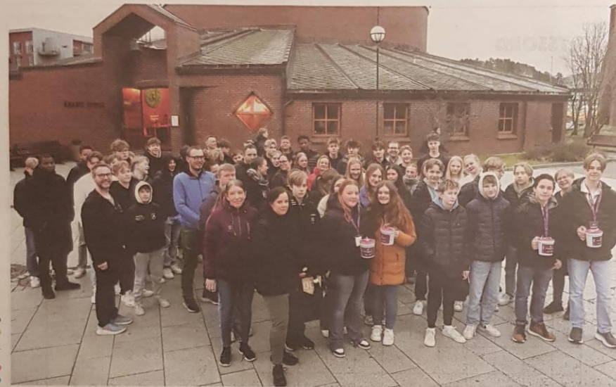
KLAR FOR AKSJON: 140 konfirmanter i Åsane menighet skal gå med bøsser søndag 17. mars. Her er noen av dem sammen med foreldre.

Her er kanskje noen av våre fremtidige utvekslingstudenter og medlemmer?