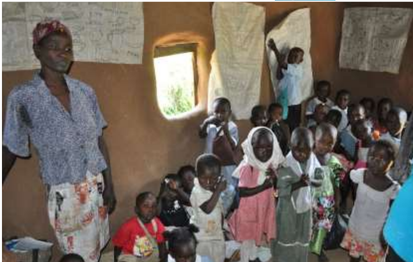
Barnehage uten leker